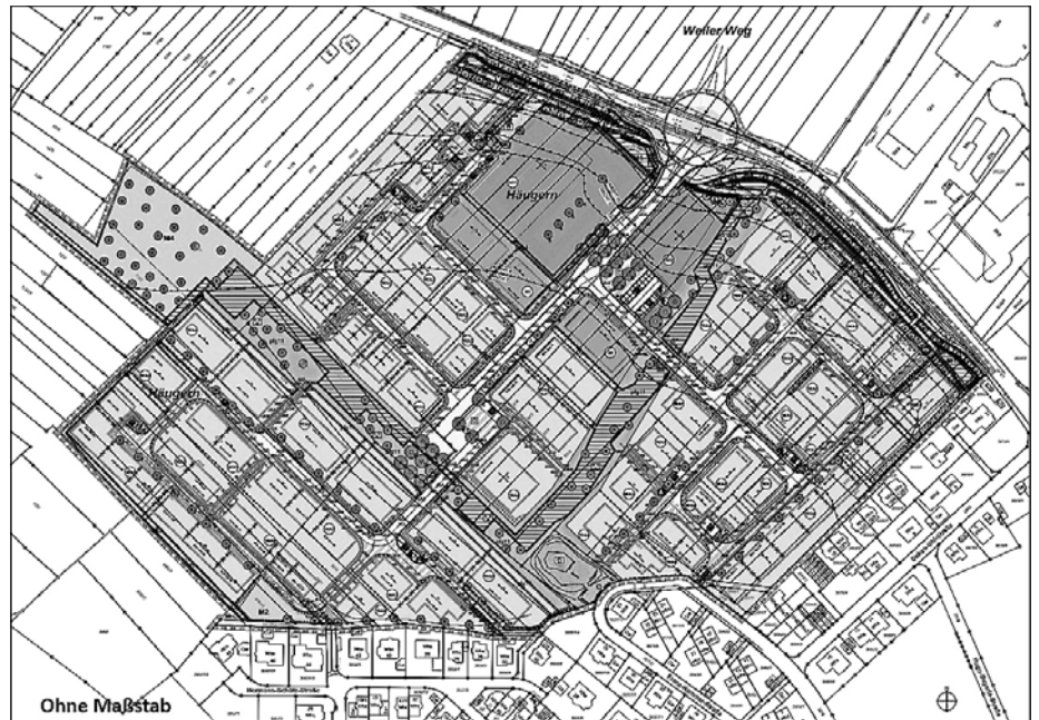
Räumlicher Geltungsbereich des erneuten Bebauungsplanentwurfs vom 30. April 2024 Grafik: Zoll Architekten Stadtplaner

Maßgebend ist die nachfolgende Abgrenzung des räumlichen Geltungsbereichs des erneuten Bebauungsplanentwurfs vom 30. April 2024.