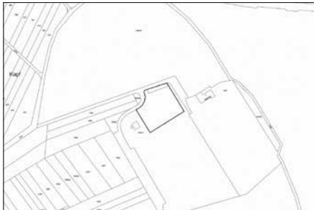
Geltungsbereich Flächennutzungsplanänderung „PV Tennisheim“

Das Plangebiet liegt südlich des Siedlungsgebiets im Außenbereich der Gemarkung Hausen, Stadt Weil der Stadt. Das geplante Gebiet umfasst im Wesentlichen die Spielfläche des Turn- und Sportvereins Hausen/Würm (Teilfläche Flst. 1003/1). Zudem beinhaltet der Geltungsbereich die nördlich an die Tennisplätze angrenzende Grünstruktur sowie einen Teil der nördlich angrenzenden Straße (Teilfläche Flst. 1003/2). Die Teilfläche der Straße soll zur Errichtung des Trafogebäudes und von zwei Stellplätzen dienen. Die Gesamtfläche des Geltungsbereichs beträgt ca. 0,24 ha.